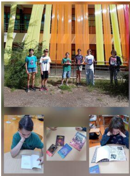
Jeunes en librairie : choix de livres.