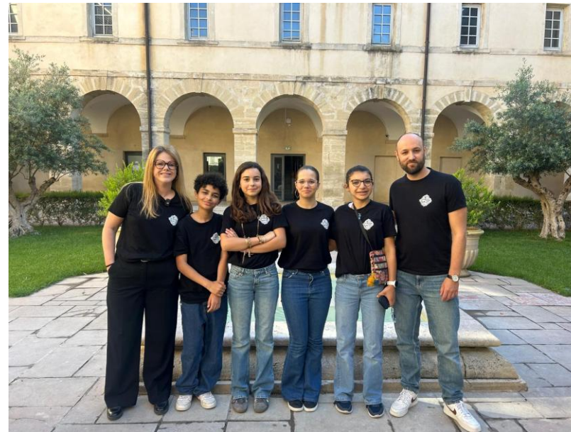
Concours : Les droits fondamentaux.