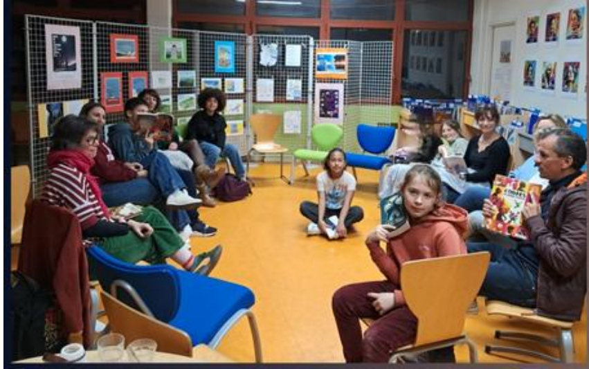
Nuits de la lecture au CDI.

... et des projets ouverts à tous les élèves, et/ou réalisés avec l'accompagnement des parents: