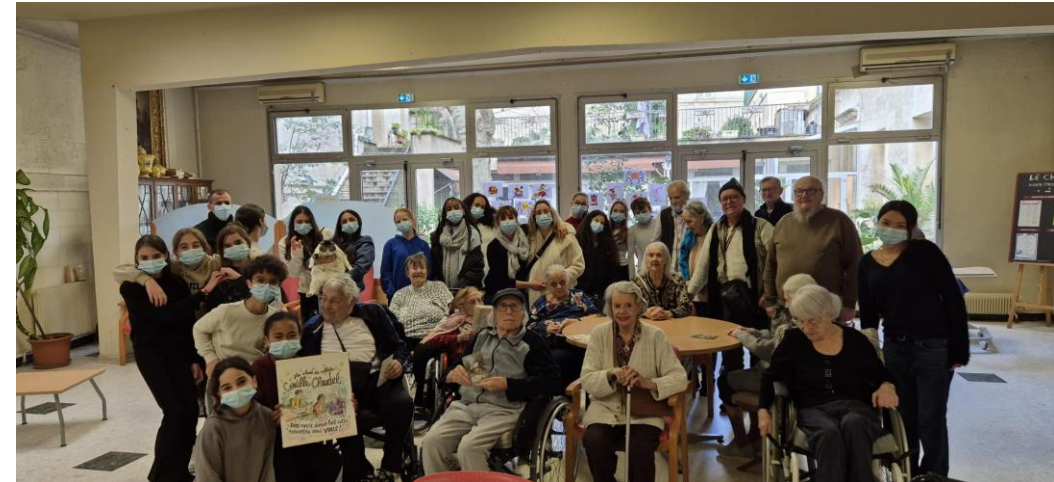
Première rencontre intergénérationnelle à la résidence Montpelliéret.