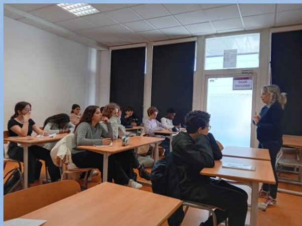
Forum des métiers.