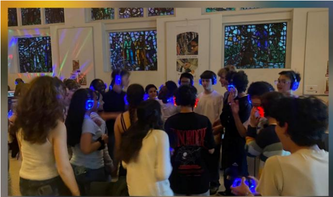
Voyage aux Pays-Bas