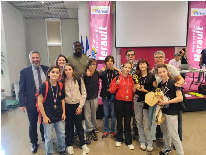
Club bridge récompensé.