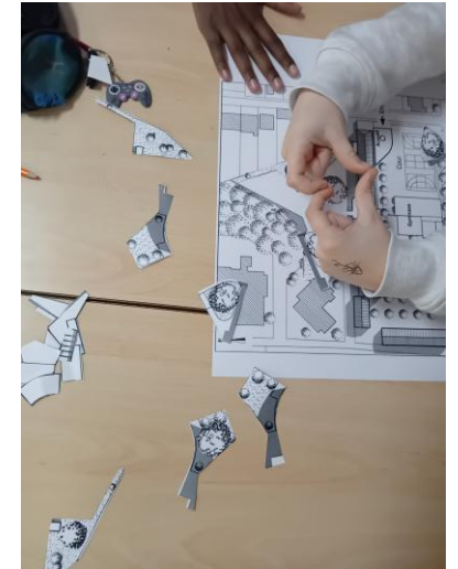
AET : le plan du collège.