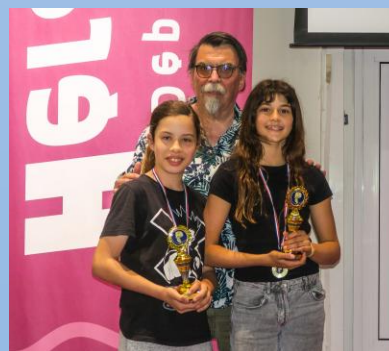
Club bridge récompensé.