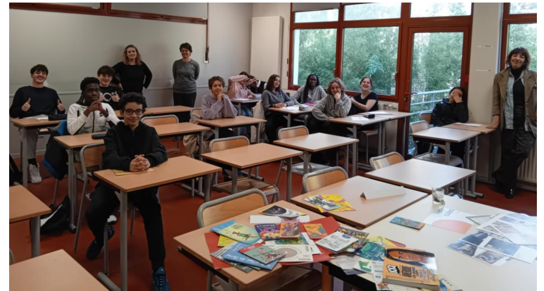
Forum des métiers pour les élèves de Troisième.