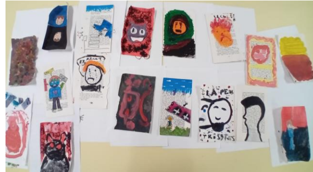
Camillettes avec les étudiants : illustrations d'émotions.