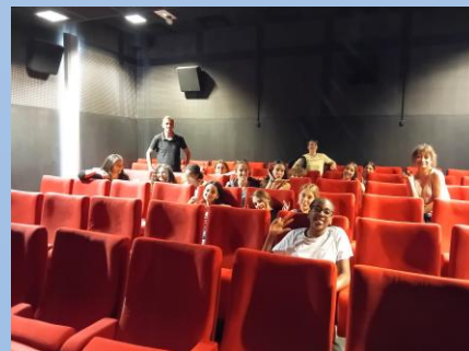
Élèves du CVC.