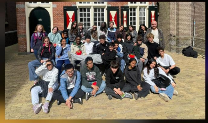
Voyage en Allemagne