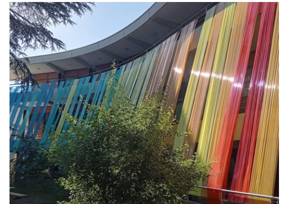
AET : installation finale.